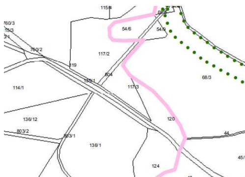
Obrázek 1 - Výřez z územního plánu města Sedlčany

Stavba je v souladu s územně plánovací dokumentací, neboť dochází pouze k opravě stávajícího stavu.